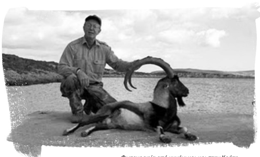
Φωτογραφία από κυνήγι κρι-κρι στην Κρήτη

Σαφώς, ο Άνθρωπος Κυνηγός είναι ένα πατριαρχικό κατασκεύασμα που διογκώνει το ρόλο που παίζανε οι άντρες στην κοινωνική αναπαραγωγή και ελαχιστοποιεί τις συνεισφορές των γυναικών. Παρατηρώντας τους χιμπατζήδες, οι φεμινίστριες έχουν διακρίνει ότι τα περισσότερα τρόφιμα αποκτώνται με τη συλλογή, όχι με το κυνήγι. Η ανάλυση των σύγχρονων ανθρώπινων πολιτισμών κυνηγών-συλλεκτών δείχνει ότι τα εργαλεία χρησιμοποιούνται επίσης κυρίως για συλλογή (φυτών, αυγών, μικρών εντόμων και ζώων) όχι για κυνήγι, ότι τα περισσότερα από τα εργαλεία φτιάχνονται και χρησιμοποιούνται από γυναίκες, και ότι οι γυναίκες συλλέγουν το 60-90% της τροφής. Κατά συνέπεια, μια πολύ πιο ακριβής άποψη της πρόωρης ανθρώπινης ιστορίας θα επέλεγε όχι τον Άνδρα Κυνηγό αλλά μάλλον τη Γυναίκα Συλλέκτη, γιατί στις πρώτες κοινωνίες οι γυναίκες διαδραματίζουν σημαντικότερο ρόλο στη σίτιση των οικογενειών, στην κοινωνικοποίηση των νεαρών ατόμων και στην απόκτηση και στο μοίρασμα της γνώσης που μεταβιβάζεται στις επόμενες γενεές.